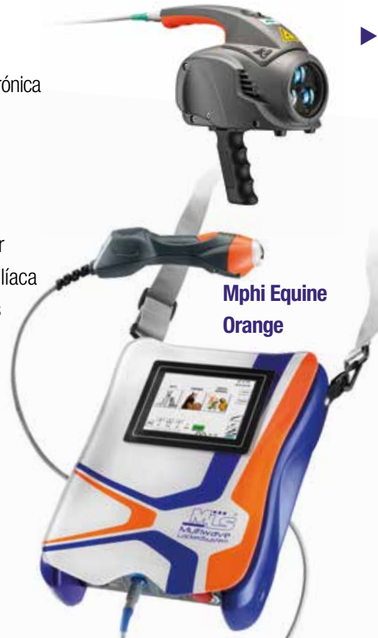
Mphi Equine Orange